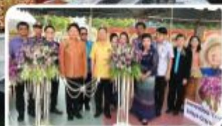
“ตักบาตรท่อน้ำวินลอยกระทง”