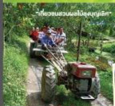
“เที่ยวชมสวนผลไม้สูงนุงยูเอค”