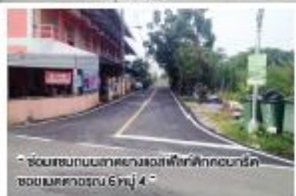
“ซ่อมแซมถนนลาดยางเขตฟาร์มศึกษาของกรม ชลประทานบริเวณที่ 6 หมู่ 4”