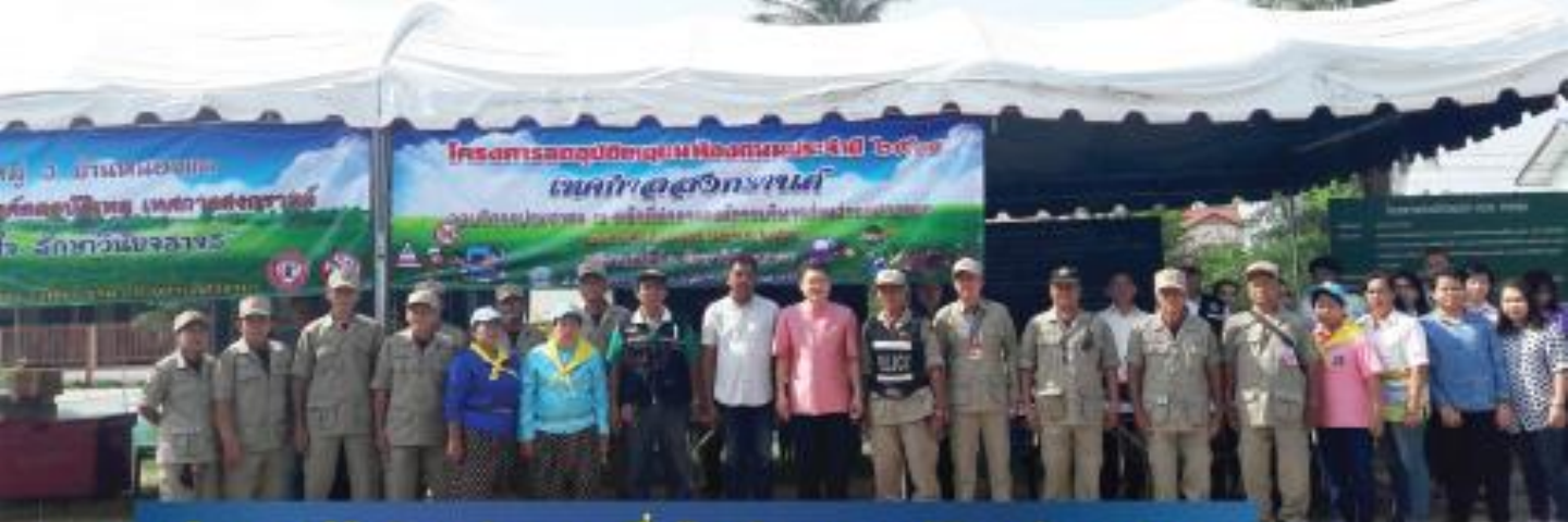
"โครงการให้บริการประชาชนเพื่อป้องกันและลดอุบัติเหตุช่วงเทศกาล"