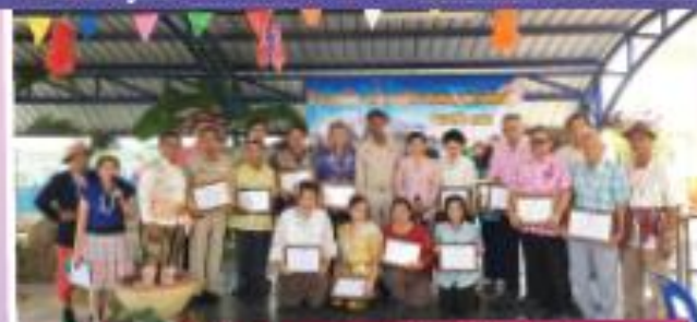
"โครงการเชิดชูเกียรติผู้สูงวัย"

salaya subdistrict Administrative Organization