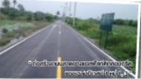
“ก่อสร้างถนนลาดยางเขตฟาร์มศึกษาของกรม ชลประทานบริเวณที่ 1 หมู่ 1, 2”