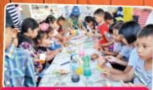
งานวันเด็ก อบต.ศาลายา