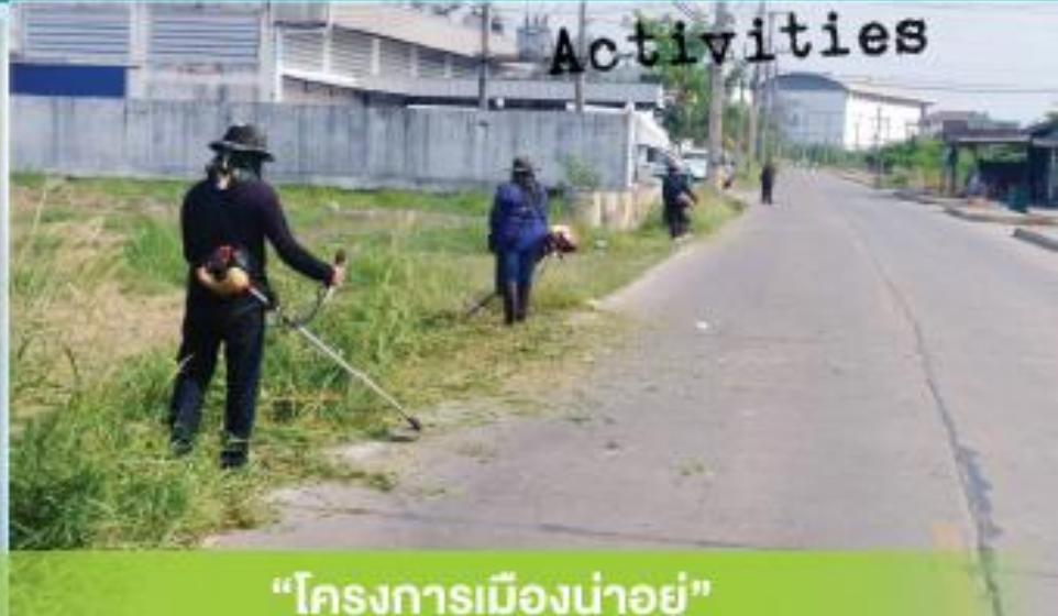
“โครงการเมืองน่าอยู่”