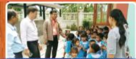
"ผู้บริหาร อบต. ตรวจเยี่ยมศูนย์พัฒนาเด็กเล็ก"