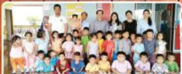
"ศูนย์พัฒนาเด็กเล็ก อบต.ศาลายา หมู่ ๕"