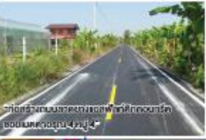
“ก่อสร้างถนนลาดยางเขตฟาร์มศึกษาของกรม ชลประทานบริเวณที่ 4 หมู่ 4”