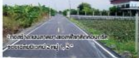
“ก่อสร้างถนนลาดยางเขตฟาร์มศึกษาของกรม ชลประทานบริเวณที่ 2 หมู่ 1, 2”