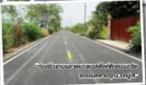
“ก่อสร้างถนนลาดยางเขตฟาร์มศึกษาของกรม ชลประทานบริเวณที่ 3 หมู่ 4”