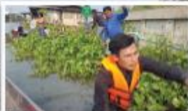
“โครงการกำจัดวัชพืชและผักคตบงวาในคลอง”

Salaya Subdistrict Administrative Organization