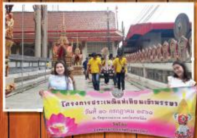
โครงการประเพณีห่มเทียนเข้าพรรษา วันที่ ๑๖ กรกฎาคม ๒๕๖๑ ณ วัดพระพุทธบาทน้ำพุ Salaya