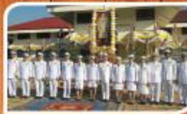
"วันคล้ายวันเฉลิมพระชนมพรรษา รัชกาลที่ 9"