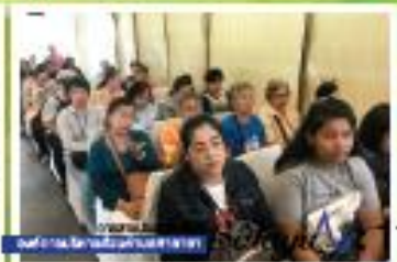
“อบรมส่งเสริมอาชีพ”