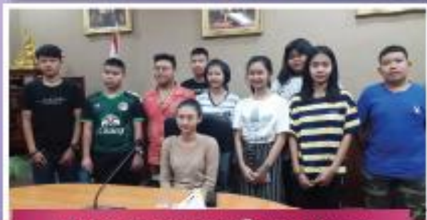
"ส่งเสริมกิจกรรมสภาเด็กและเยาวชน"