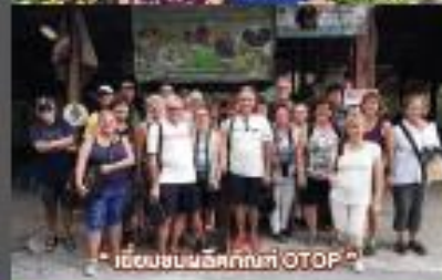
“เขียนชมเชยให้กับที่ OTOP”