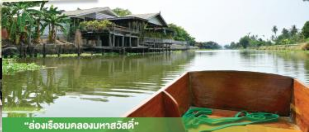
“ส่องเรือชมคลองมหาสวัสดิ์”

Salaya subdistrict Administrative Organization