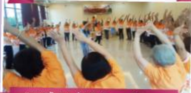
"การสนับสนุนส่งเสริมกิจกรรมผู้สูงอายุ"