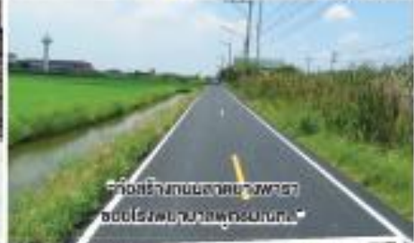
“ก่อสร้างถนนลาดยางฟาร์ม ชลประทานบางนาพรตบริเวณที่ 1”