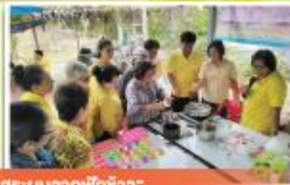
“ทำสบู่และขนมจากฟักข้าว”