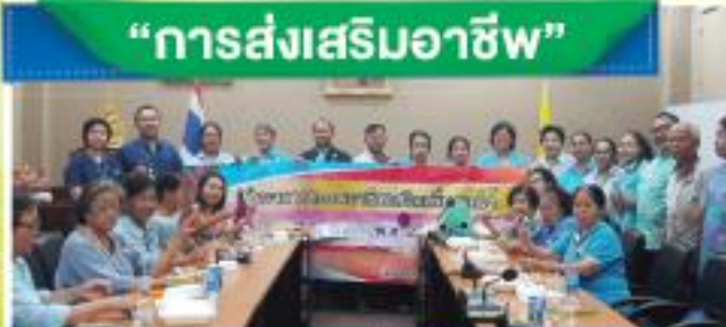
“งานประดิษฐ์ดอกไม้”