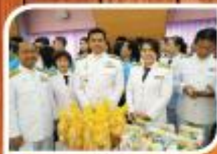
"วันแม่แห่งชาติ"