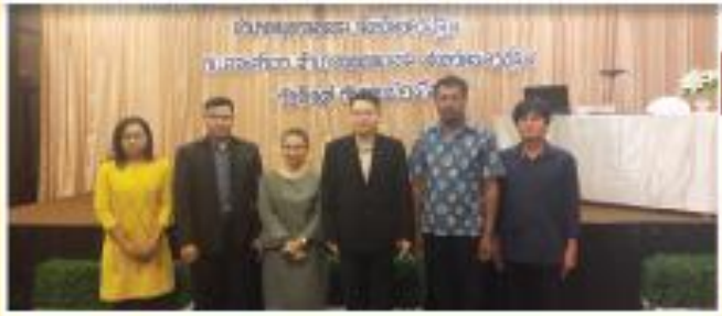
"โครงการบริหารจัดการและพัฒนากิจการจับจ่ายได้"