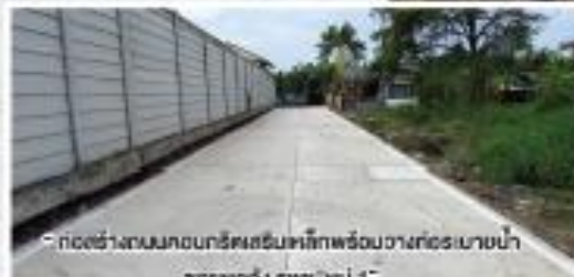
“ก่อสร้างถนนคอนกรีตเสริมเหล็กพร้อมวางท่อระบายน้ำ” ซอยทอง ธรรม: หมู่ 1