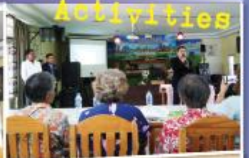
โครงการศึกษาฐานแทนน้ำสุภาพ อบต.ศาลายา ณ จังหวัดลพบุรี