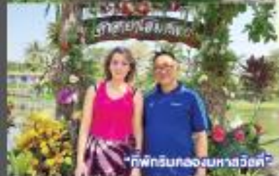
“ที่พักผ่อนของมหาสวัสดิ์”