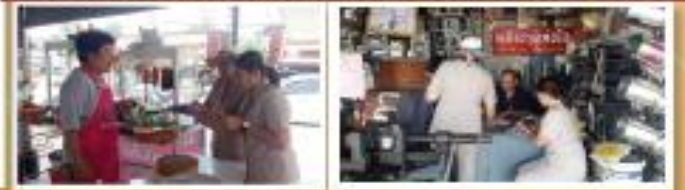
"โครงการประชามตงกันเพื่อกิจการจับจ่ายพัฒนาตงกัน"