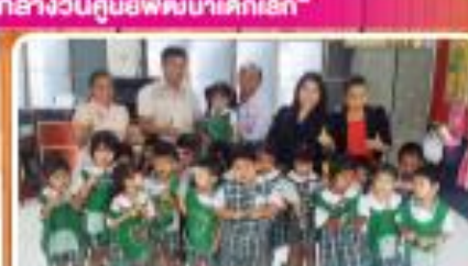
"ศูนย์พัฒนาเด็กเล็ก อบต.ศาลายา (บ้านวัดสุวรรณ)"