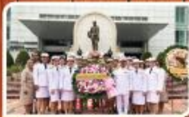
"วันปิยะมหาราช"