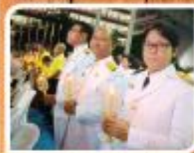
"วันเฉลิมพระชนมพรรษา รัชกาลที่ 10"