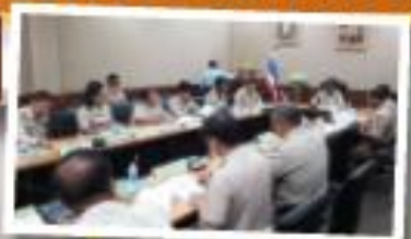
"โครงการพัฒนาบุคลากร" ของ องค์การบริหารส่วนตำบลสาละยา