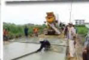
“ก่อสร้างถนนคอนกรีต” ซอยนุกูลอุทิศ 3 หมู่ที่ 1