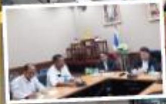
"รับการตรวจเยี่ยมและให้ความรู้" เกี่ยวกับการป้องกันการปฏิบัติหน้าที่โดยมิชอบ จากกรมการ ป.ป.ช.จังหวัดนครปฐม"