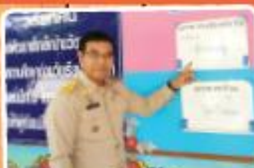
"โครงการอาหารกลางวันศูนย์พัฒนาเด็กเล็ก"