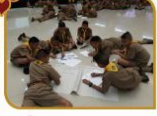
โครงการค่ายเยาวชนต้นยาเสพติด