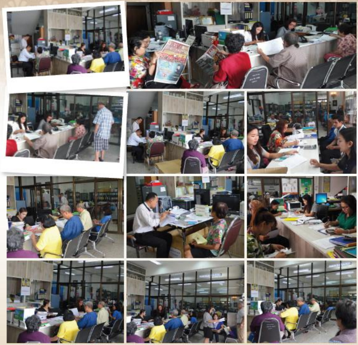
การออกหน่วยและบริการประชาชนในการจัดเก็บภาษี