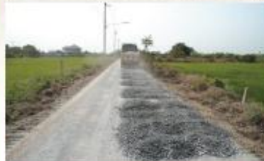
เฉลิมนิเวศน์ 2