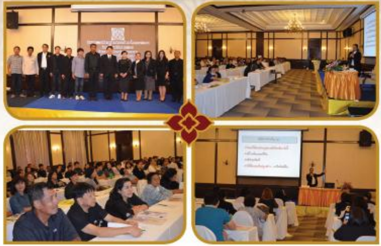
โครงการอบรมให้ความรู้การชำระภาษีตามที่กฎหมายกำหนด