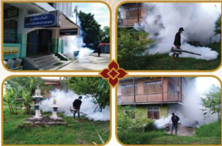
โครงการณรงค์ป้องกันไข้เลือดออก