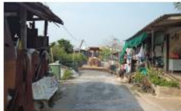
เสียบคลองทวิวัฒนา