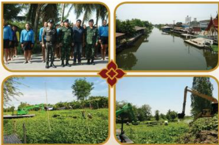
โครงการกำจัดผักตบชวา