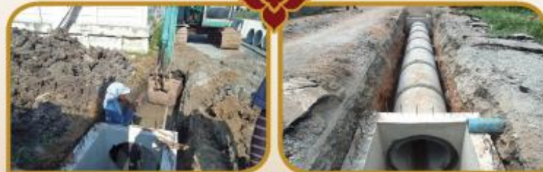
โครงการวางท่อระบายน้ำ ช.หอถัก รพช ม.1