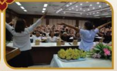
อบรมศึกษาดูงานด้านแพทย์แผนไทยและวิถีชีวิตของชมรมผู้สูงอายุ

โครงการพัฒนาศักยภาพอาสาสมัครสาธารณสุขและศึกษาดูงาน ปีงบประมาณ 2560