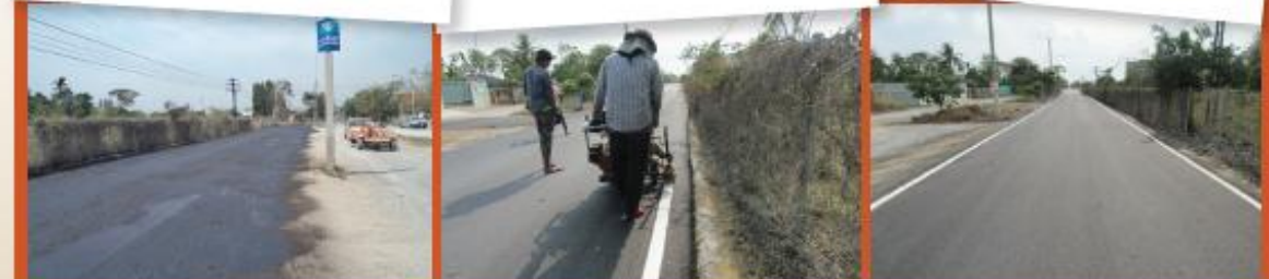
ลาดยางหน้า รร.วัดสุวรรณาราม ม.1