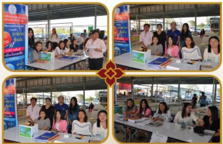
การออกหน่วยและบริการประชาชนในการจัดเก็บภาษี