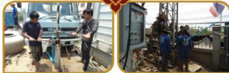
ชุดเจาะบ่อบาดาล หมู่ 1- หมู่ 5