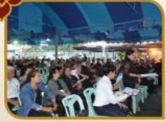
โครงการประชุมท่อกันเพื่อการจัดทำ แผนพัฒนาท้องถิ่น