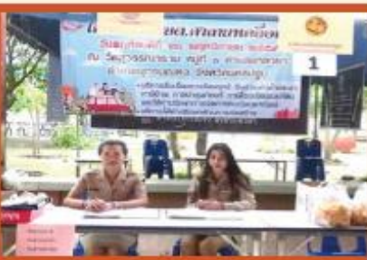
โครงการ อบต. สาขายาเคลื่อนที่ ณ วัดสุวรรณาราม