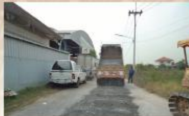
เฉลิมนิเวศน์ 1