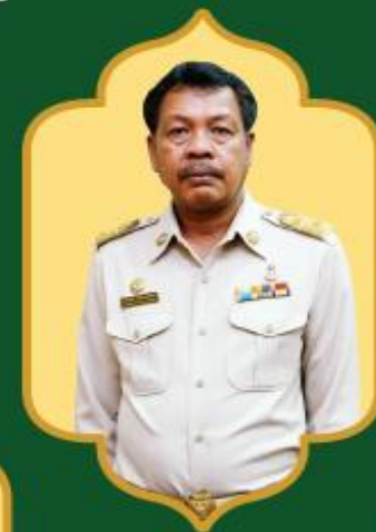
อำนวยการ นายก อบต. ศาลายา