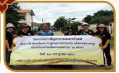
กิจกรรมบำเพ็ญสาธารณประโยชน์ Big Cleaning Day