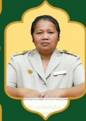
รองนายก อบต. ศาลายา