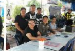
โครงการป้องกันและลดอุบัติเหตุทางถนน ช่วงเทศกาล “ขับรถมีน้ำใจ รักษาชีวิตจราจร”