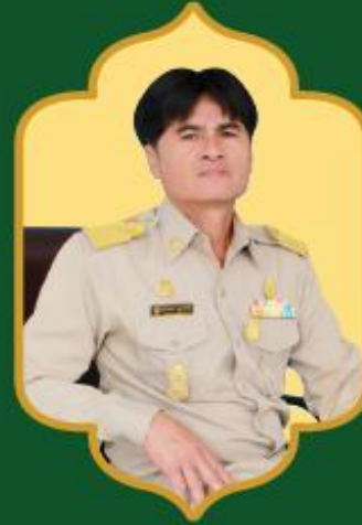
รองนายก อบต. ศาลายา