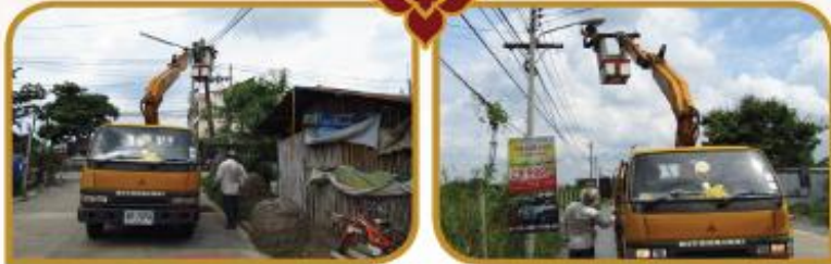
ปรับปรุงซ่อมแซมไฟฟ้าสาธารณะ ม.1-5