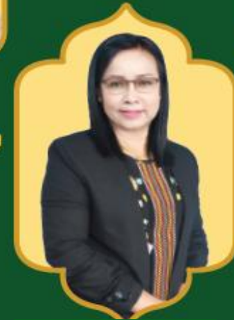
เลขานุการนายก อบต. ศาลายา