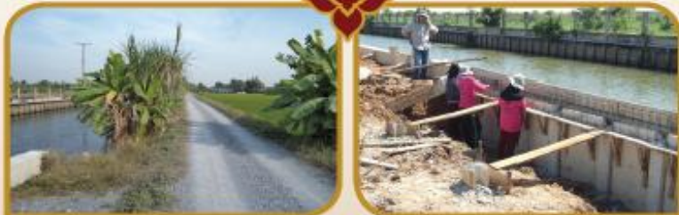
สร้างเขื่อนป้องกันตลิ่งคลองตาหลี่