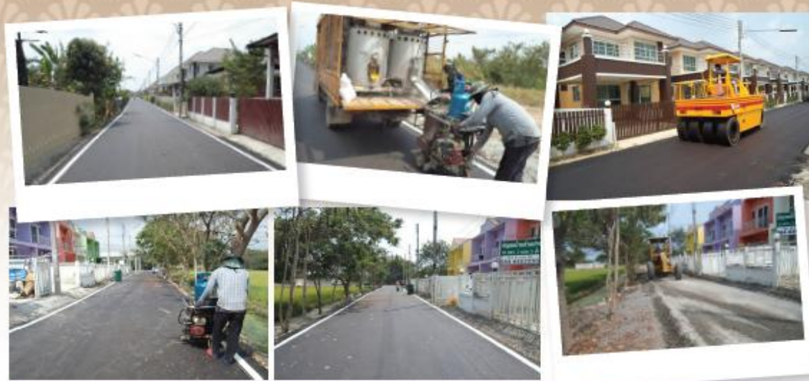
ก่อสร้างถนนคอนกรีตเสริมลายนวตา 5 ม.4